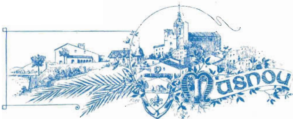
Capçalera del setmanari "La Costa de Llevant". Dibuix d'en Flos i Calcat.

Quedan abiertas desde el 1.º del presente las clases nocturnas, para todas aquellas personas que deseen enterarse de cualesquiera de las asignaturas antedichas, incluso la enseñanza primaria. Dichas clases principian á las seis.