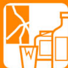
Vidre i vidre pla