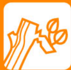
Restes de jardí